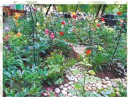
НОВИКОВА НИНА НИКОЛАЕВНА ул. Шоссейная, д.42, под.1-2