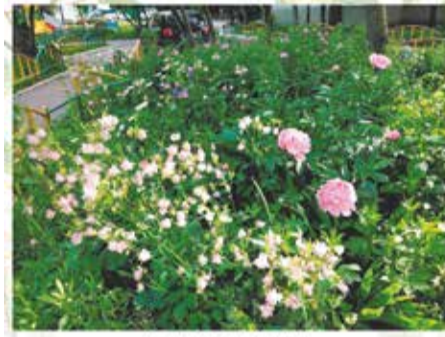
МИКШИНА ЛАРИСА ВЛАДИМИРОВНА ул. Гурьянова, д.41 (двор)